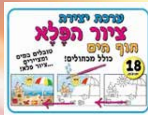
עבודת יצירה קסומה לכל ילד