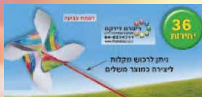
שבשבת ספירלה תלת מימד