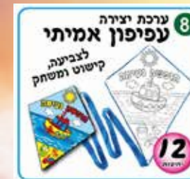
כל ילד יקבל עפיפון אמיתי לצביעה