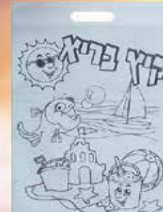
כל ילד יקבל תיק אישי לצביעה